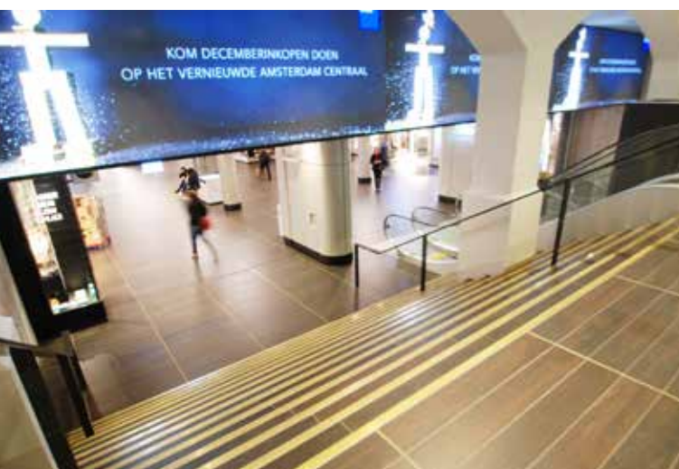
Speciale profielen voor de trap