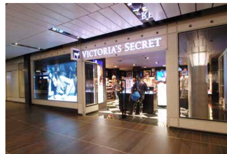
Houtlook combineert goed met winkelvloeren

DÉ LEVERANCIER IN AFBOUWMATERIALEN VOOR DE GROOTHANDEL